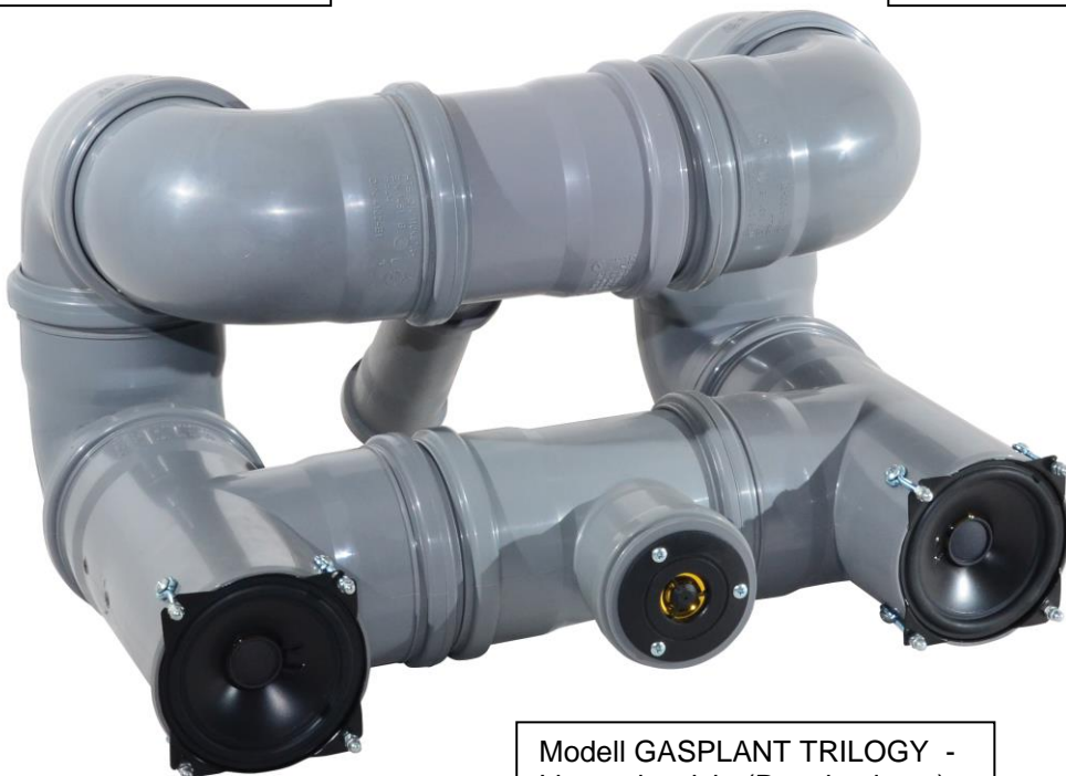
Modell GASPLANT TRILOGY - Liegendansicht (Regalvariante)