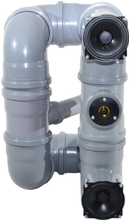
Modell GASPLANT TRILOGY - Seitenansicht