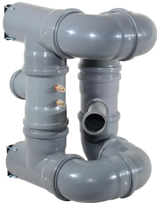
Modell GASPLANT TRILOGY - Frontalansicht